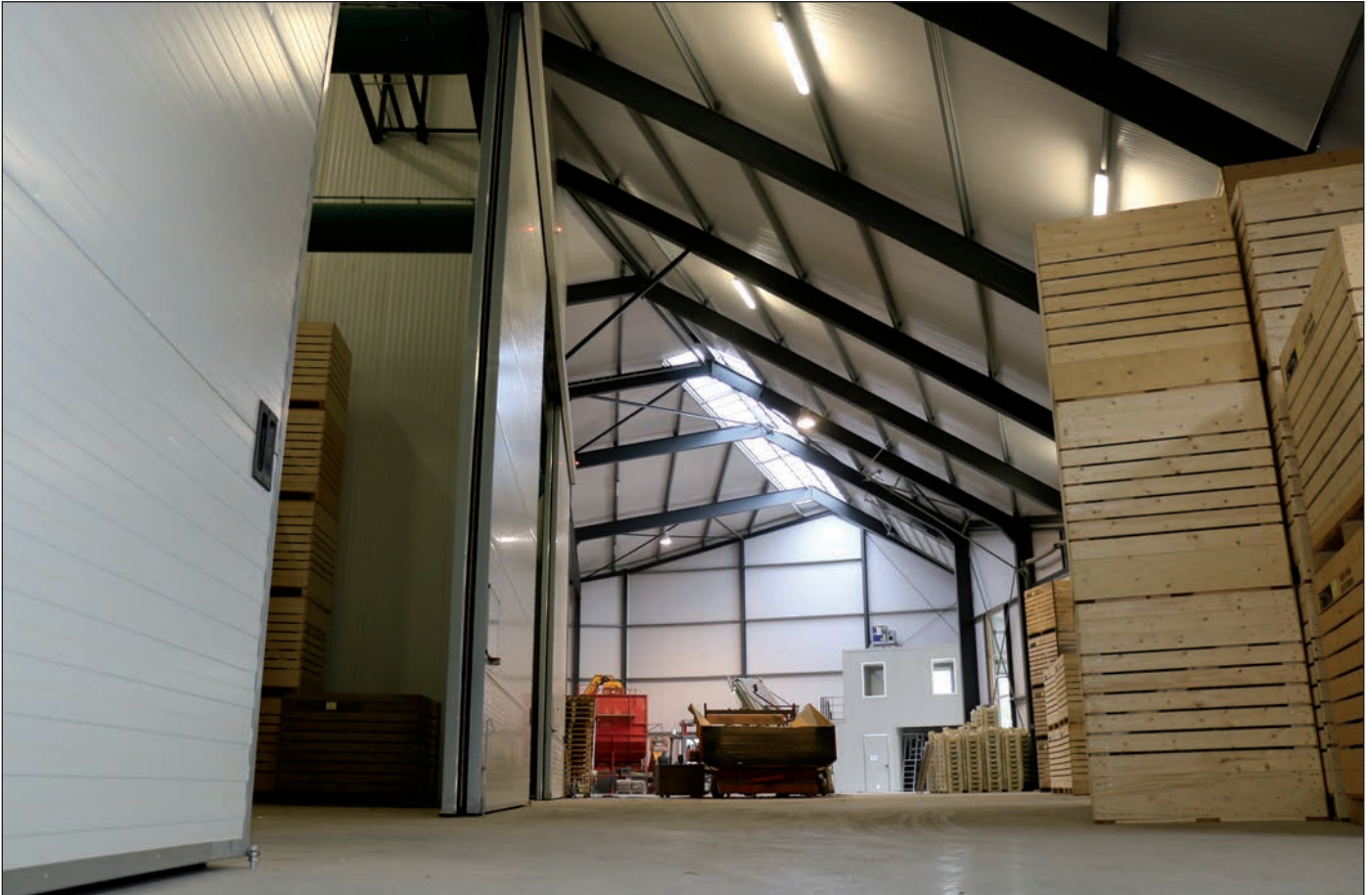
De enige rechthoekige vormen van de schuur, zie je pas als je de loods binnenstapt. Dat zijn namelijk de koelcellen.

ten. “Daardoor krijg je ook tijdens de wintermaanden mee wat voor weer het is en wat er op het erf gebeurt. Ik vind dat heel prettig werken.”